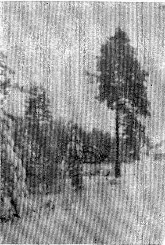
За околицей.

«Всем посетителям привет! На праздник просим к нам быстрее. Сегодня даже тот, кто сед, На десять лет помолодеет».