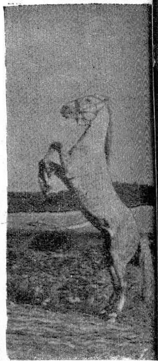
На снимке: один из лучших рысачей колхоза «Светлый путь» Красногородского района.