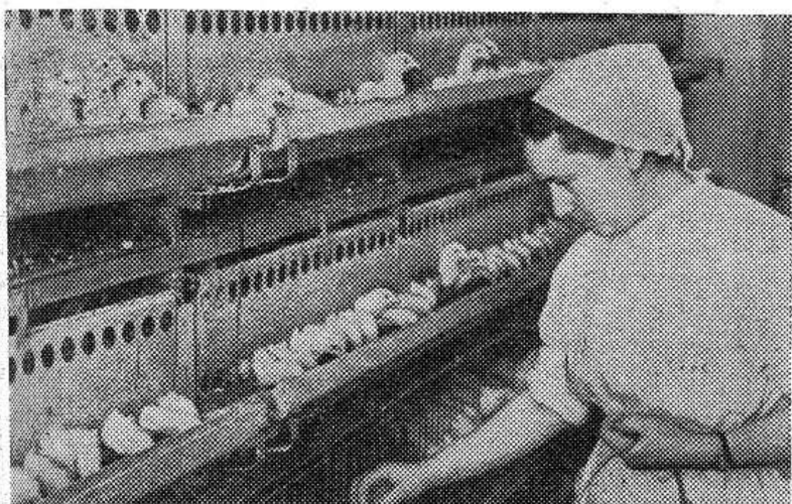
150 тысяч рублей прибыли дала в прошлом году Карачевская птицефабрика, крупнейшая в Калужской области. От каждой несушки здесь было получено по 182 яйца.