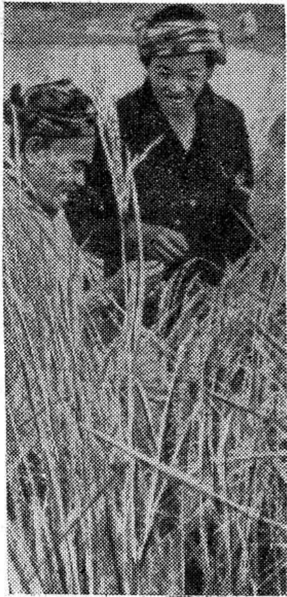
ЛАОС. Не покладая рук трудятся на благо отчизны население районов, контролируемых патриотическими силами. На свободной земле зеленеют поля и огороды, прокладываются сотни оросительных каналов. На снимке: хороший урожай выращен на бесплодных прежде землях.

15 февраля в Индии начались очередные всеобщие выборы. В первый день голосование проходит в 193 избирательных округах по выборам в народную палату центрального парламента и в 772 округах по выборам в законодательные собрания штатов Андхра Прадеш, Бихар, Гуджарат, Мадрас, Махараштра, Майсур, Раджастан, Уттар Прадеш и союзной территории Манипур. На территории этих избирательных округов проживает около 60 миллионов избирателей из общего числа почти 251 миллион избирателей. Нынешние всеобщие выборы являются четвертыми со времени обретения Индией независимости.