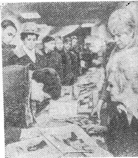
У книжного прилавка в Берлине идет сбор денежных средств в фонд помощи вьетнамскому народу.