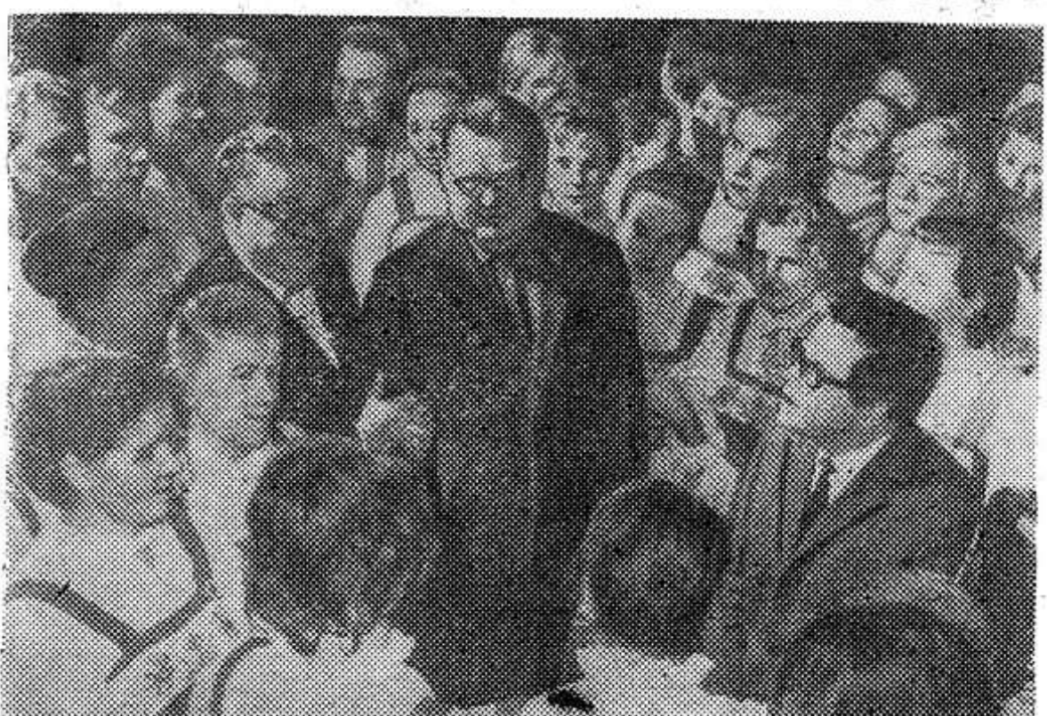
Ленинградцы — желанные гости у своих северных соседей — жителей Карельской республики. На этом снимке председатель правления Ленинградского отделения Союза композиторов