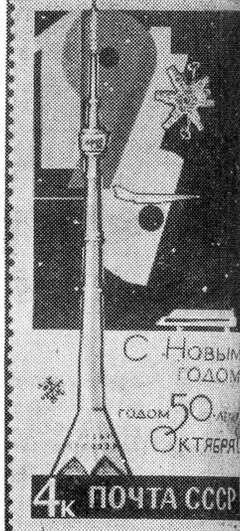
МОСКВА. Министерство связи СССР выпустило почтовую марку «С Новым годом, годом 50-летия Октября!»

На 39 процентов возросла стоимость жизни в Уругвае за последние 11 месяцев. Согласно официальным статистическим данным, более всего поднялись цены на продукты питания. Наряду с этим, сообщает корреспондент агентства Пренса Латина из Монтевидео, значительно повысилась квартирная плата.