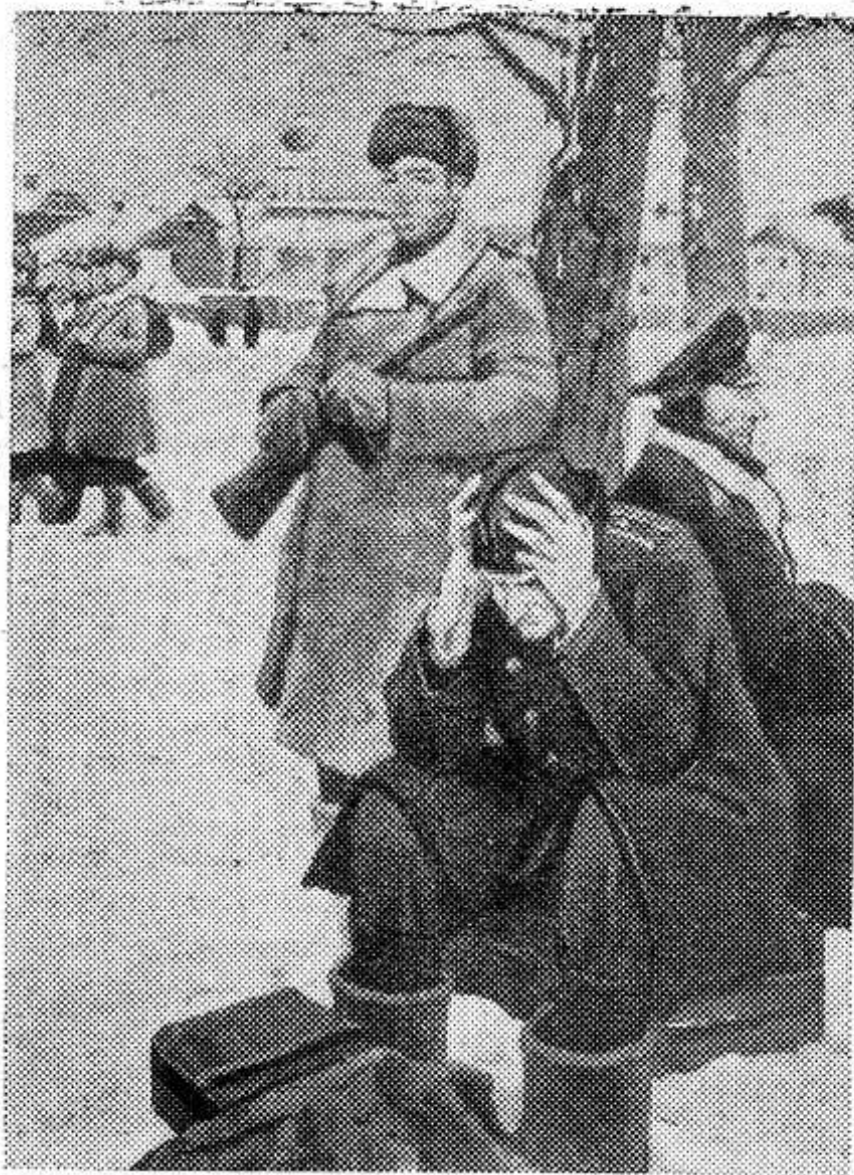
МОСКВА. В Центральном зале открыта художественная выставка, посвященная 25-летию разгрома немецко-фашистских войск под Москвой.

На снимке: картина художника Л. И. Нардицкого «Наша пошла на Мозайск».