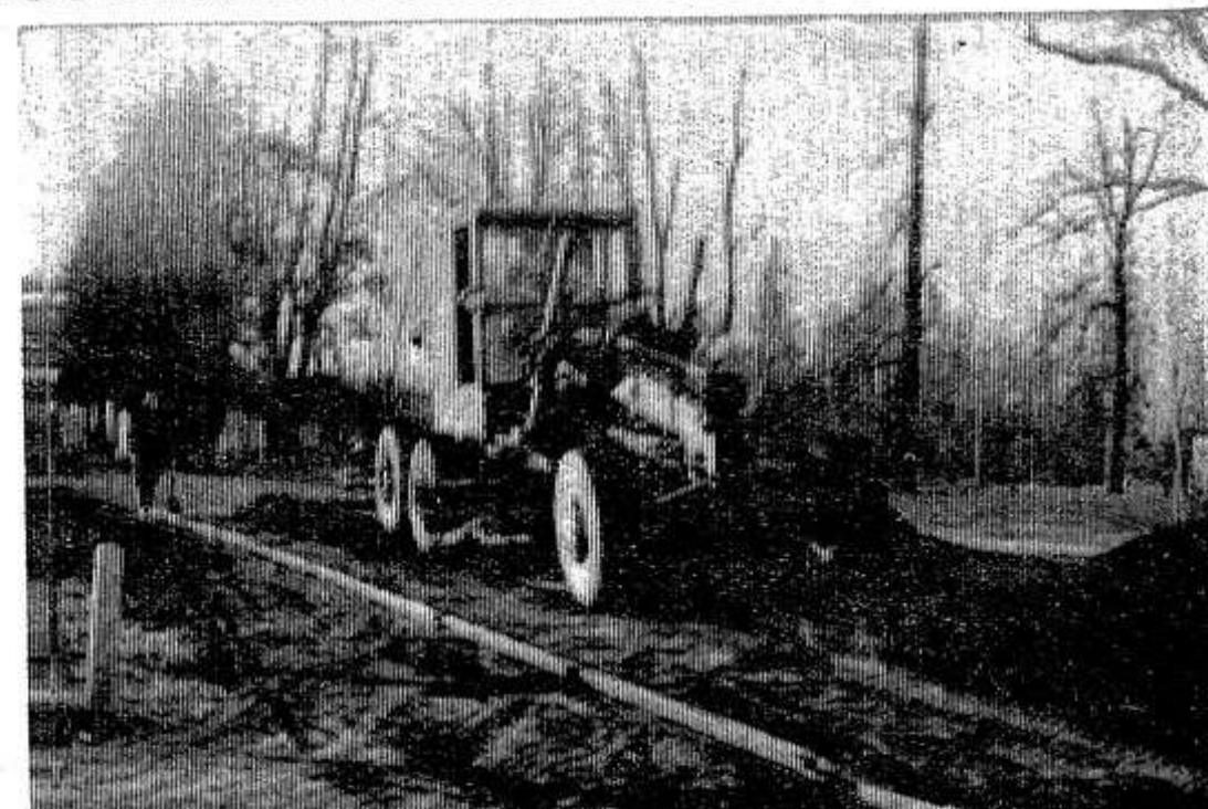
Благоустраивается центральная усадьба совхоза «Красный фронт». На снимке: асфальтирование улицы в совхозе «Красный фронт».

В. Дмитриева, заведующая Позолотинской библиотекой.