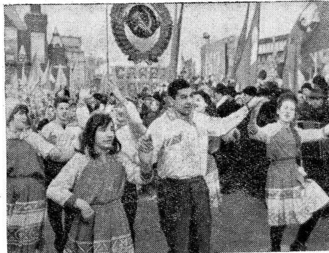
МОСКВА. 7 ноября 1966 года. Празднование 49-й годовщины Великой Октябрьской социалистической революции.