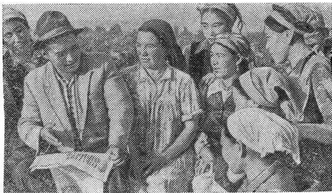
Хорошо поставлена агитационно-массовая работа в колхозе имени Калинина Ленинского района (Киргизская ССР). Пропагандисты и агитаторы регулярно проводят беседы о жизни