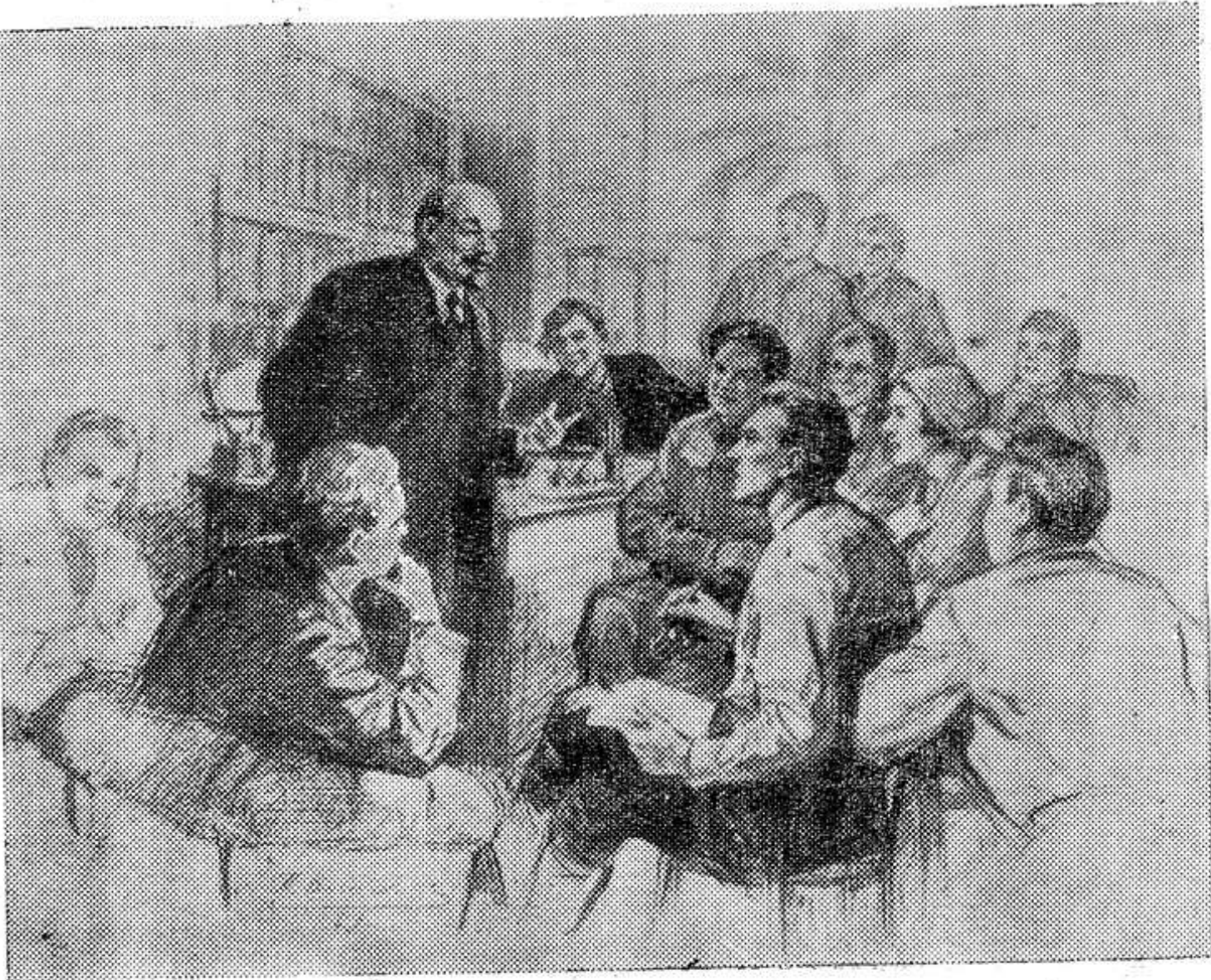
на снимке: комсомольцы — охранники I съезда ВЛКСМ у В. И. Ленина.