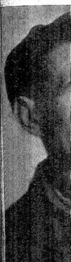
Беспокойна... ...овхоза «Кра... ...А. Кузнец... ...вермах хозяй... ...шее количест... ...техники. И, в... ...случаи выхоб... ...Здесь уже... ...Бориса Алекса... ...тись. Его «ле... ...на вызов без... ...роткий срок... ...любую неисп... ...На снм... ...цов.

— Молодцы, ст... ...аются о работ... «Межколхозст... сельхозартели «Г... Да, слов нет, ...здесь появил... зданий и сооруж... енного и культ... значения. Постр... ом соответстви... ...аками, надолго. Повышение то... строительства... ...востно, завис... пользования сре... Тому, кто 15—2... тал на сельских... ...как тяжело... ...поднимать... ...трехметровую в... ...Теперь совсем... ...помощь ручном... ...механизмы. Вме... ...лица появились... ...сделаны они и