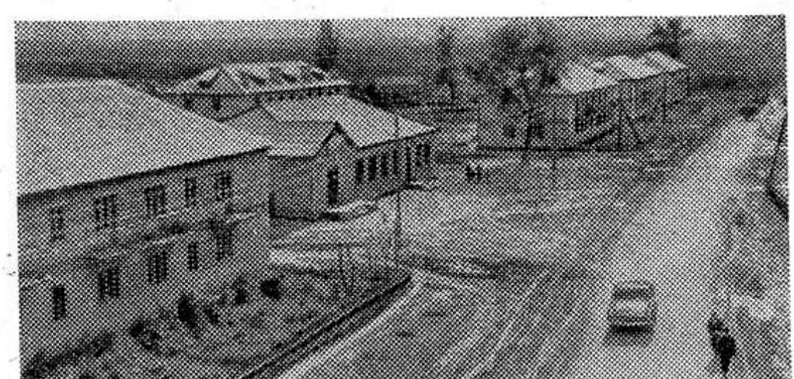
РЯЗАНСКАЯ ОБЛАСТЬ. За Окой, в окружении берез и сосен раскинулись поля высокопродуктивного совхоза «Варские Шумашь».

Растет и благоустраивается центральная усадьба хозяйства. Около ста семей живет в благоустроенных квартирах, построена школа на 420 учащихся, детский сад на сто мест, заасфальтирована дорога. К пятидесятилетию Советской власти