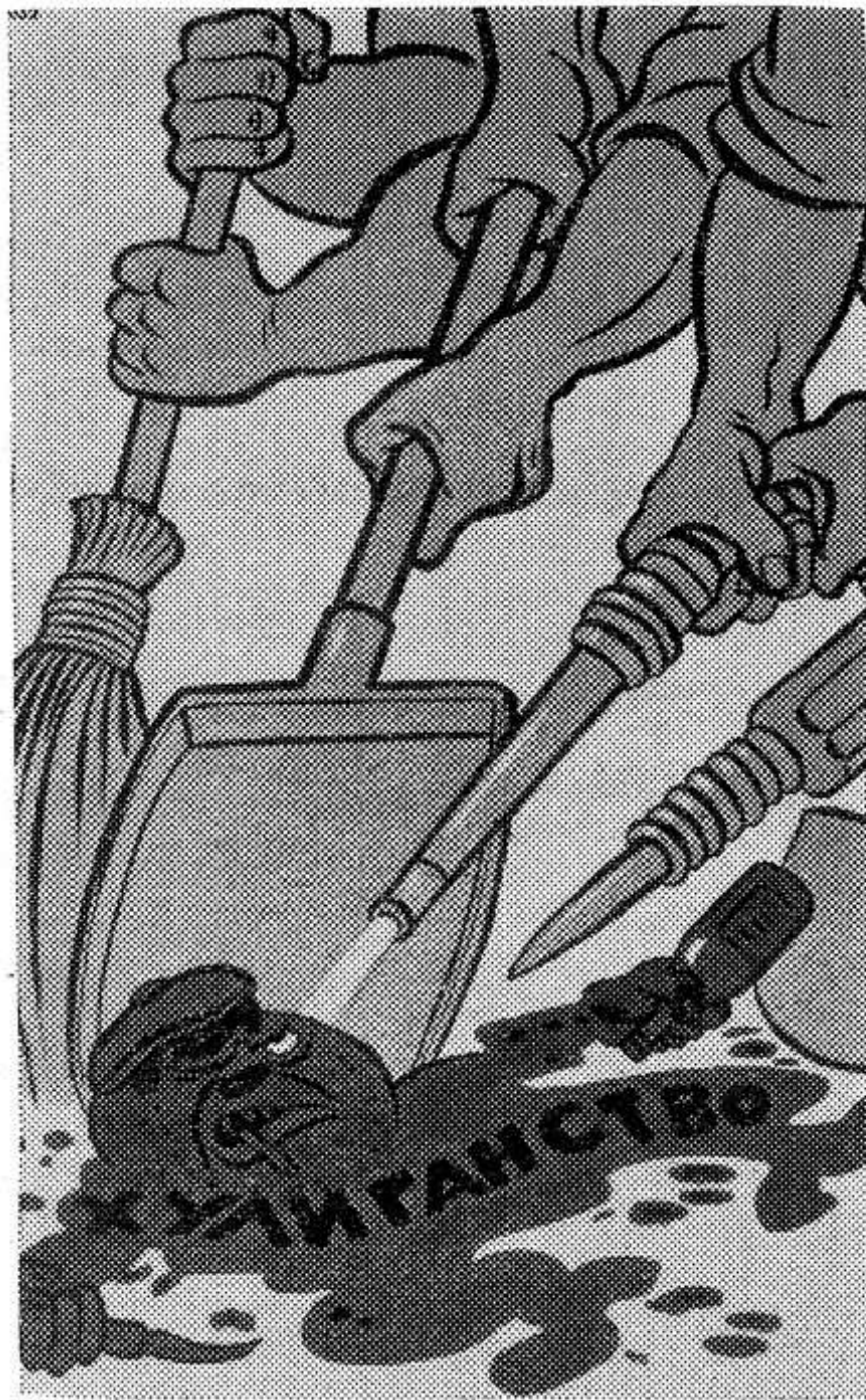
Следуя народному указу, справимся, друзья, с напастью злой: выжжем хулиганскую заразу, счистим, смоем, выметем метлой! Художник Бор. Ефимов. Стихи А. Жарова.

Вместо того, чтобы принять нужные меры, директор наложил на письмо резолюцию «Количество нарушений общественного порядка к общему числу рабочих предприятия не так уж велико, и не стоит поднимать вокруг этого шума, а также беспокоить меня такими сигналами... Это дело не наше.