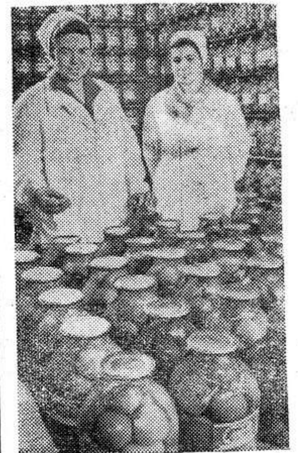
Мценский консервный овощесушильный завод (Орловская область) вырабатывает более 50 видов овощных и фруктовых консервов, выпускает сушеные картофель и лук.

Продолжают раскочку и работники потребкооперации. Отгрузка картофеля должна быть завершена в 2-3 дня.