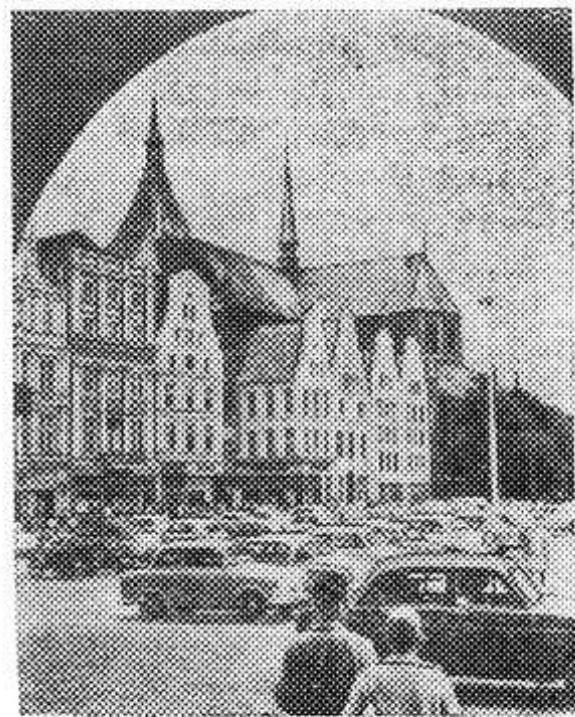
ГДР. Площадь имени Эрнста Тельмана в Ростке.

Теплые поздравления с 17-летней годовщиной, пожелания новых успехов в строительстве социализма трудящимся братской страны передала представительница советской общественности. С речью выступил Ганс Роденберг.