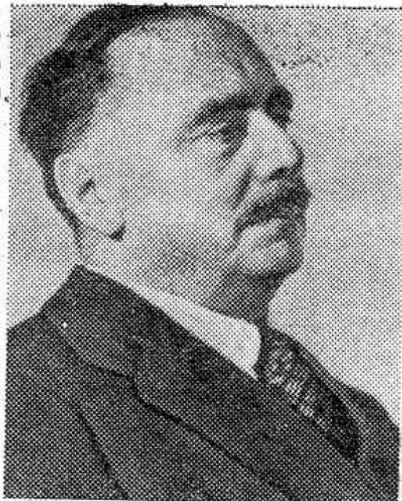
Сегодня исполнилось 100 лет со дня рождения выдающегося английского писателя-фантаста Герберта Уэллса (1866—1946), автора романов «Машина времени», «Человек-невидимка», «Борьба миров» и др.