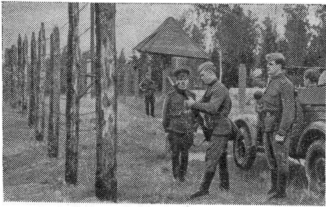
Смена караула.