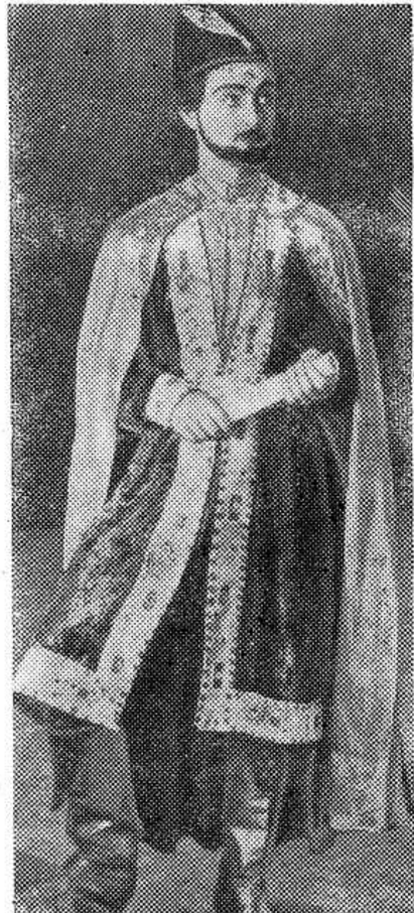
В начале сентября будет повсюду торжественно отмечаться 800-летие со дня рождения великого грузинского поэта и мыслителя Шота Руставели. Большая подготовка к юбилею идет в Грузии. Этой славной дате посвящают новые произведения поэты и прозаики, композиторы и скульпторы.

Во всех уголках республики проходят конкурсы народных сказителей, чтецов, коллективы художественной самодеятельности готовят юбилейные программы концертов.