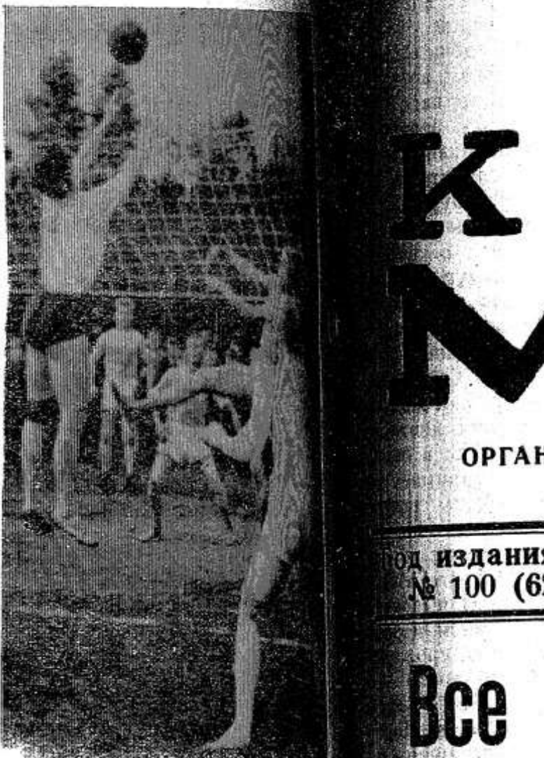
В Опочечком лесхозе спортивно-физкультурная площадка. Здесь устраиваются различные спортивные состязания. На снимке: один из моментов встречи волейболистов.