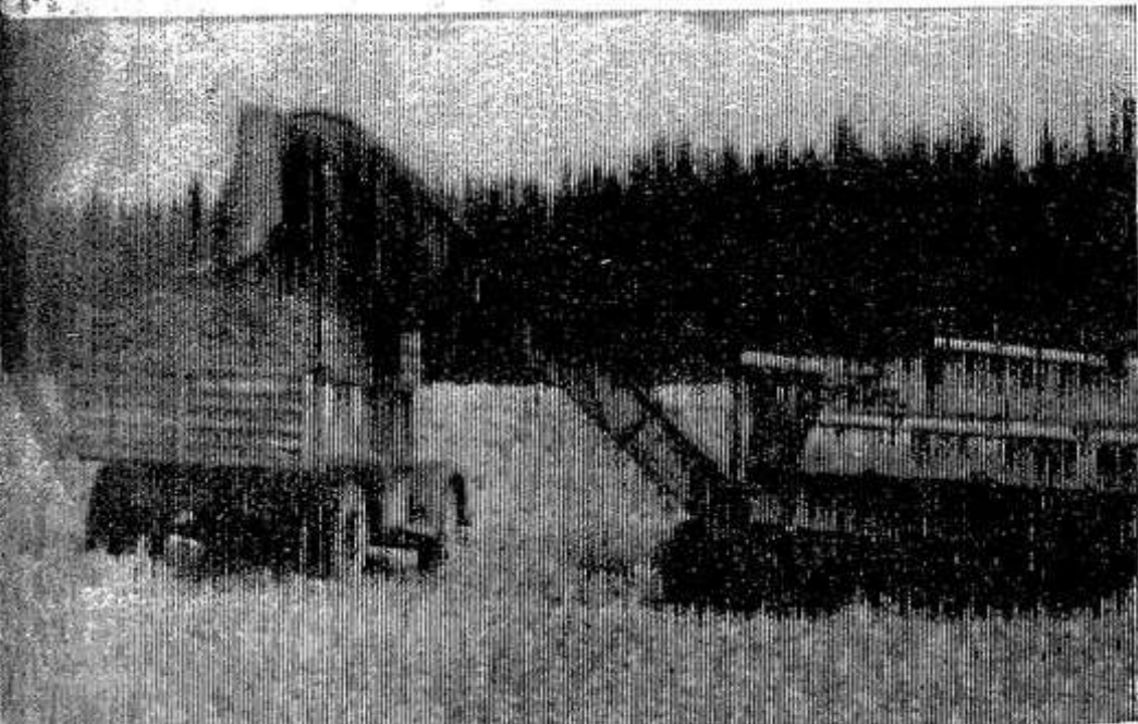
Приготовленный силос из коровьего лопина занимает немалую долю в рационе общественного скота совхоза «Красный