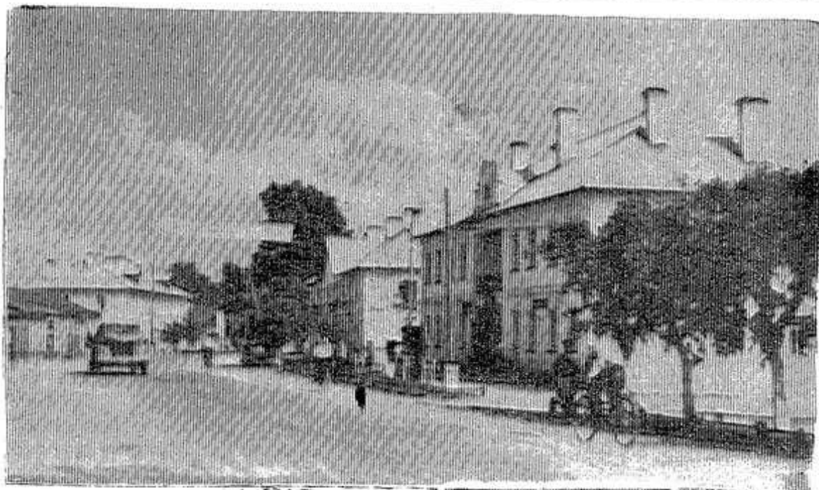
На снимке: село Красногородское, центральная улица.