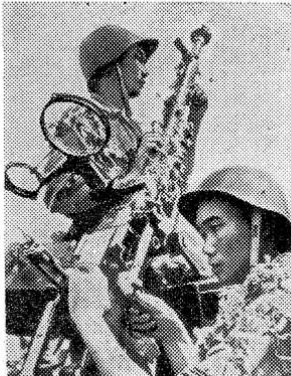
Американские воздушные пираты бомбят и обстреливают города и населенные пункты Демократической Республики Вьетнам. Против стервятников самоотверженно сражаются воины Вьетнамской народной армии и бойцы народной милиции.

В библиотечку входят следующие увлекательные и поучительные