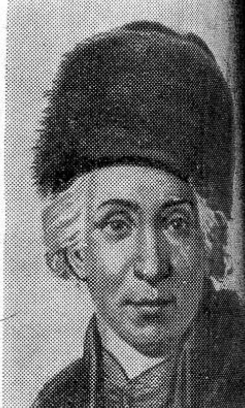
Сегодня исполняется 150 лет со дня смерти выдающегося русского поэта, представителя классицизма в русской литературе Гаврилы Романовича Державина (1743—1816 гг.). В его произведениях «Фелица», «Вельмижа», «На смерть князя Мещерского», «Приглашение к обединю звучит гражданская патриотическая тема, сатира на вельмож придворную жизнь.