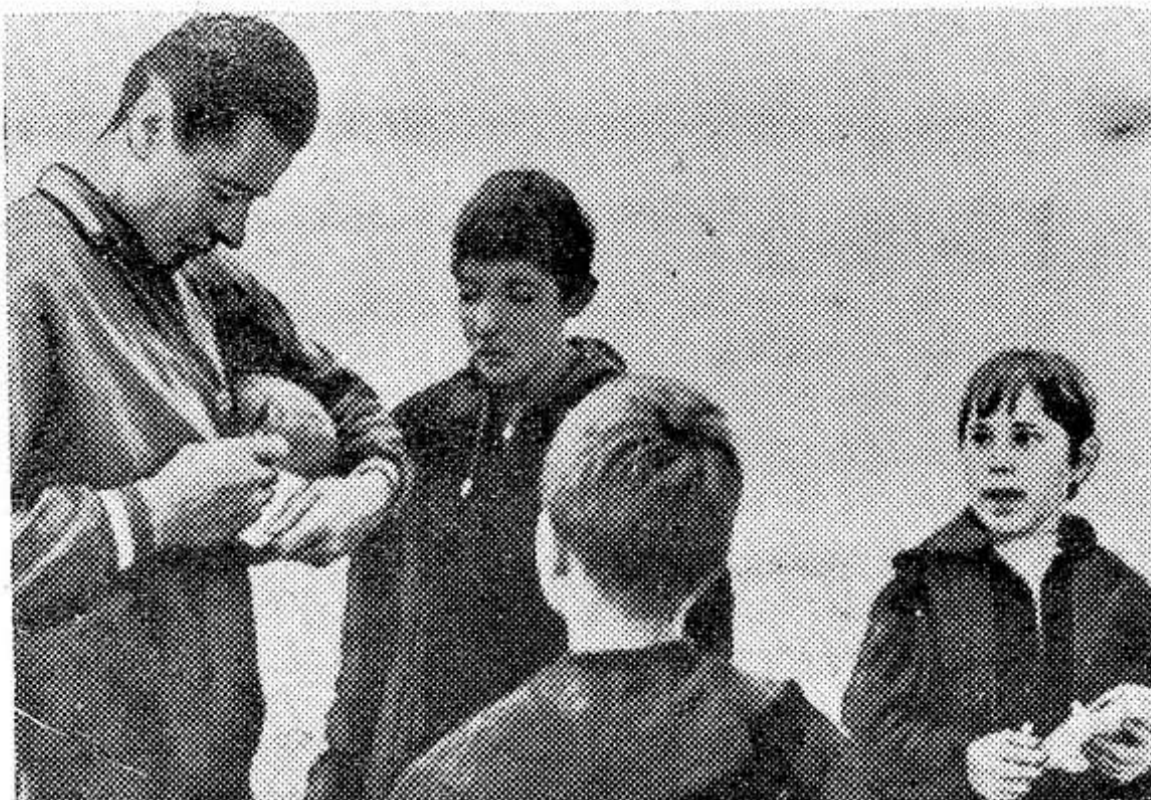
Чемпионат мира по футболу в Англии. На снимке: Лев Яшин дает автографы юным любителям футбола.

В другом документе — Заявлении в связи с американской агрессией во Вьетнаме — государства Варшавского договора самым решительным образом предупреждают правительство США от от-