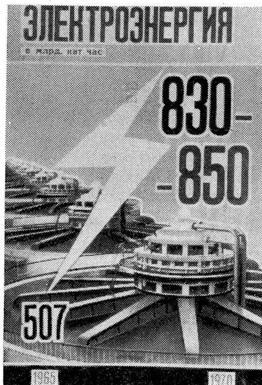
Производство электроэнергии в млрд. квт. час.