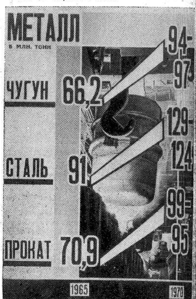
Производство металла в млн. тонн.