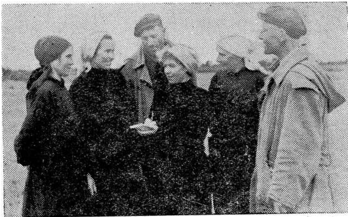
Закончилась дневная дойка коров. Итогами интересуются доярки и пастухи.

Труженники нашей артели уверены, что задания пятилетки будут успешно выполнены. Это намного повысит доходы колхоза и на этой основе возрастет благосостояние наших труженников.