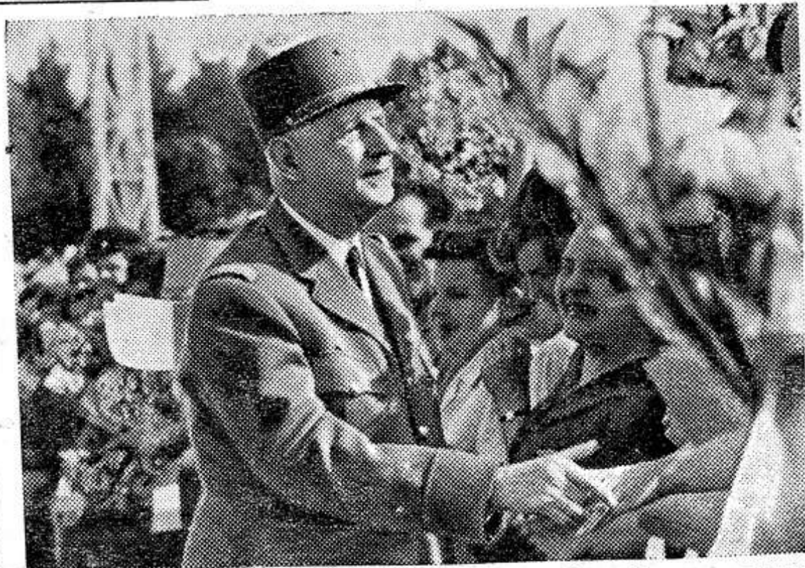
По приглашению Президиума Верховного Совета СССР и Советского правительства в Советский Союз прибыл с официальным визитом Президент Фран-

странных дел М. Кув де Мюрвиль. В ходе переговоров, проходивших в атмосфере взаимопонимания и сердечности, были рассмотрены вопросы всестороннего расширения советско-французских отношений и углубления согласия между СССР и Францией. Было продолжено также обсуждение важнейших международных проблем.