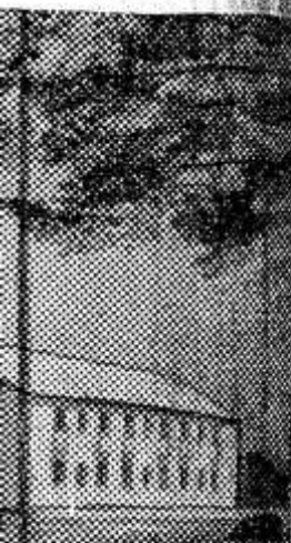
домах есть все

совхоза стал, Док. В восьми, щитой полимер, кие овощеводы, урцы. Сейчас, гектара распо, 40 пленочных, ий период огур, открытом возду, щидает расте, ий период роста, ревания, когор, ра, для расте, ла. В этом год, овхоза обяза, дать государс, цов.