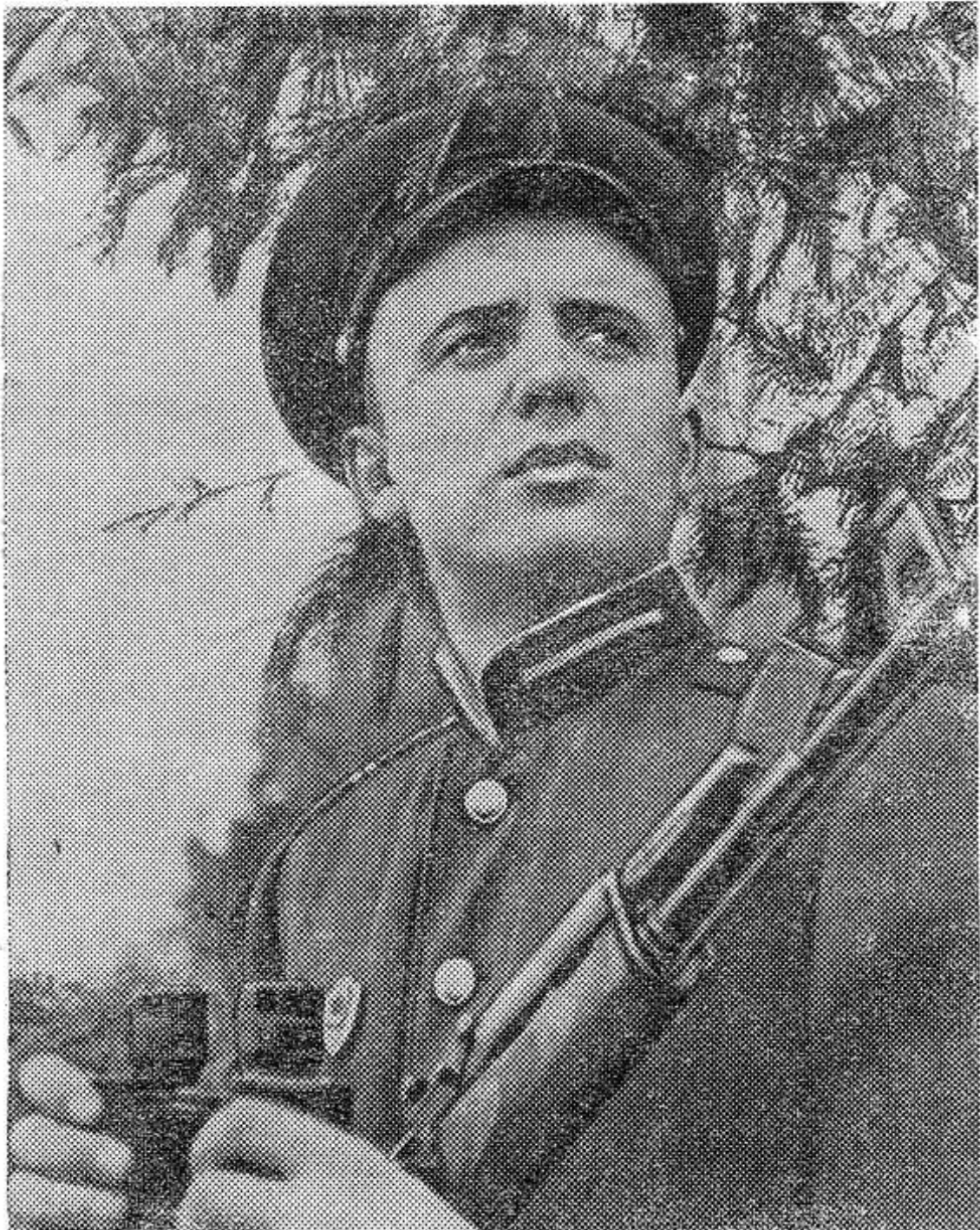
Бдительно несет службу на границе воин в зеленой фуражке!