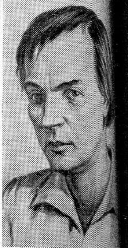
27 мая исполняется 200 лет со дня смерти ИВАНА ИВАНОВИЧА ПОЛЗУНОВА (1728—1828) выдающегося русского техника, одного из изобретателей универсального теплового двигателя. Ползунов на 20 лет раньше англичанина Джемса Уатта построил самую мощную паровую установку. Применяя оригинальных технических решений и механизмов, русский мореход опередил своего английского конкурента, добился непрерывного действия и автоматизма своей установки.