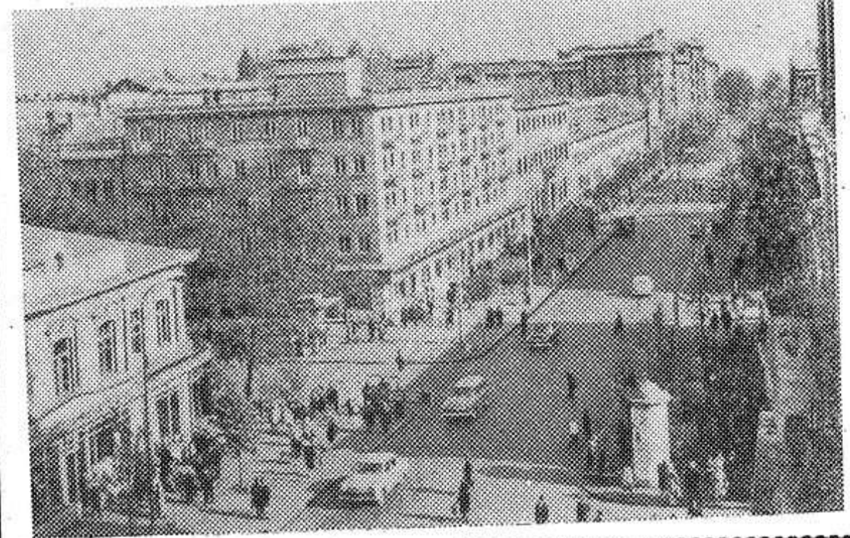
Город-герой Одесса. На снимке: Дерибасовская улица.