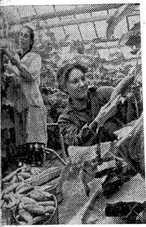
АЗЕРБАЙДЖАНСКАЯ ССР. Для овощеводов ашиеронского базовинского совхоза любая погода не помеха. «Лето» для них уже наступило: в теплицах идет сбор богатого урожая огурцов и помидоров.