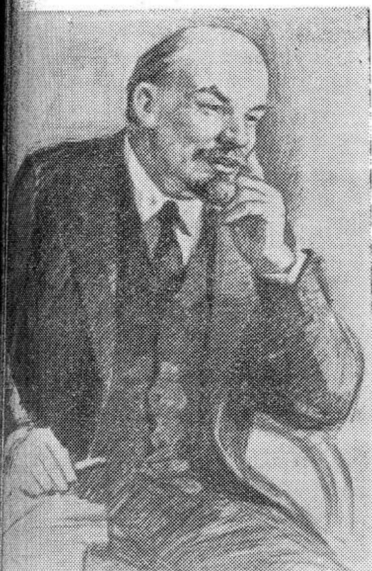
В. И. Ленин. (Рисунок заслуженного деятеля искусств РСФСР П. Васильева).