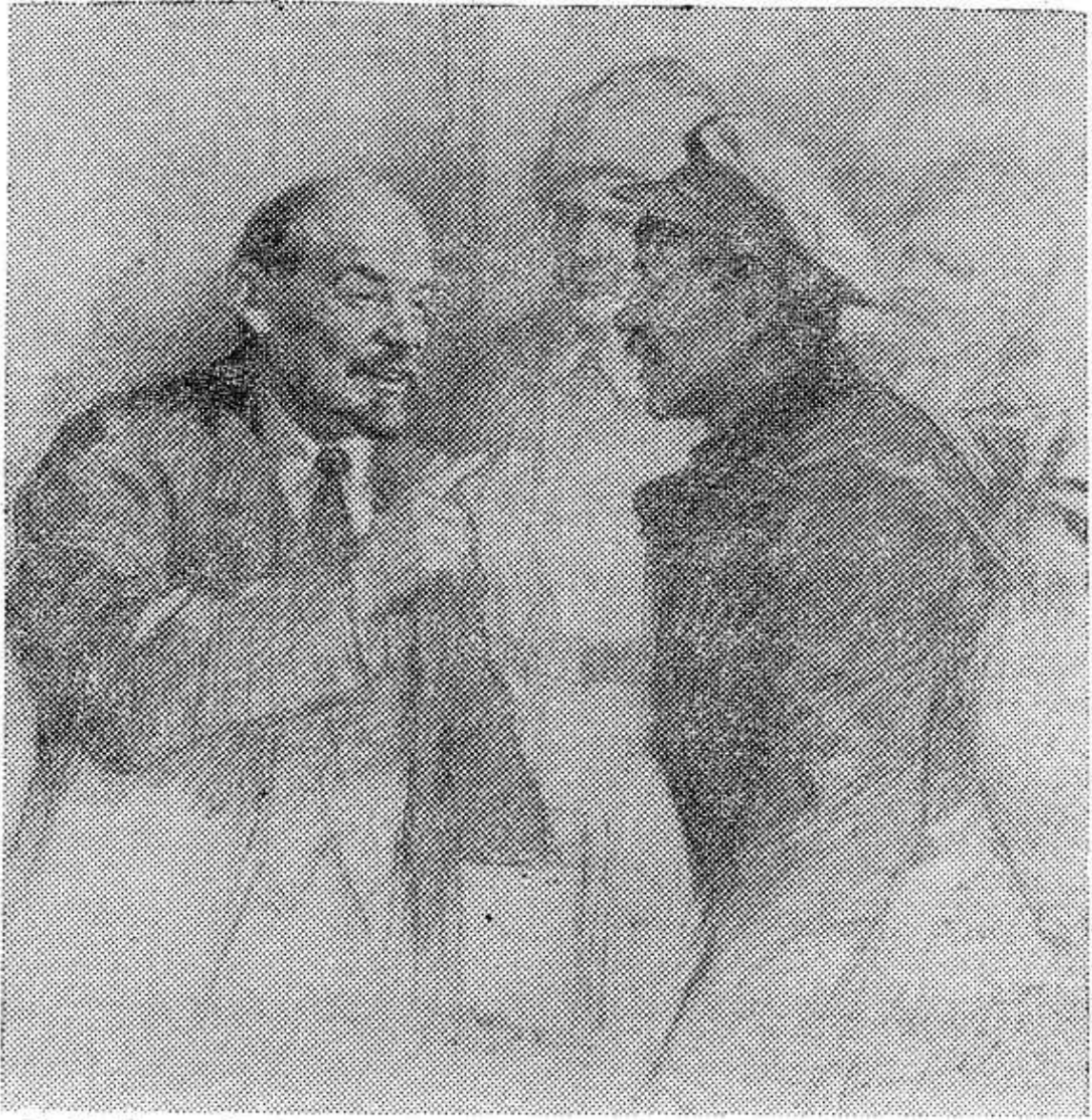
В. И. Ленин беседует с ходоками.