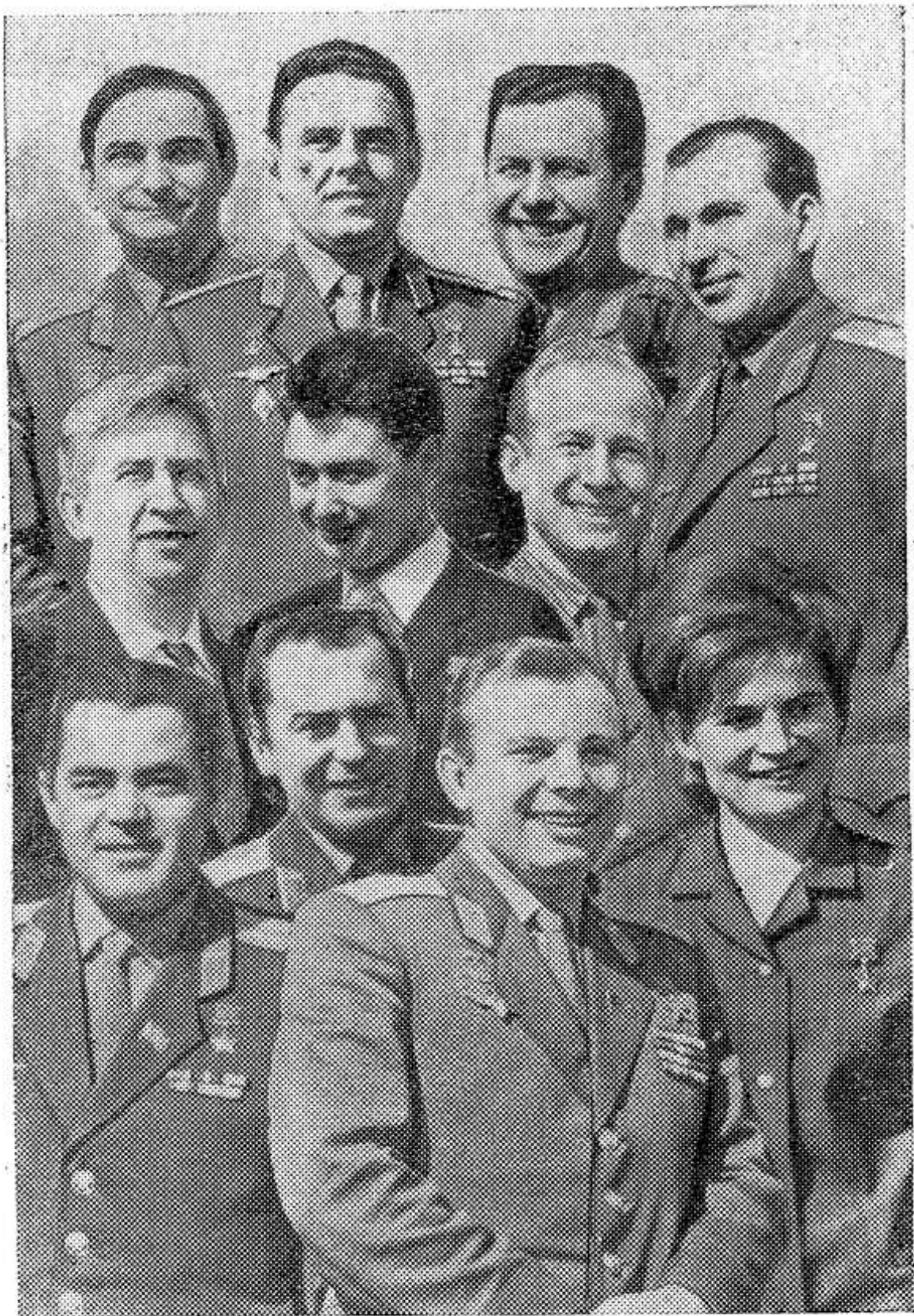
Вот они, герои, летчики-космонавты (слева направо) в первом ряду: А. Г. Николаев, Г. С. Титов, Ю. А. Гагарин, В. В. Николаева-Терешкова; во втором ряду: К. П. Феоктистов, Б. Б. Егоров, А. А. Леонов; в третьем ряду: В. Ф. Быковский, В. М. Комаров, П. Р. Попович, П. И. Беляев.