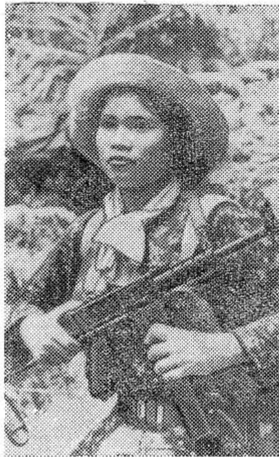
ЮЖНЫЙ ВЬЕТНАМ. Снайпер Армии освобождения.

Без промаха бьет автомат этой женщины по врагу, посвятившему на независимость ее родины.