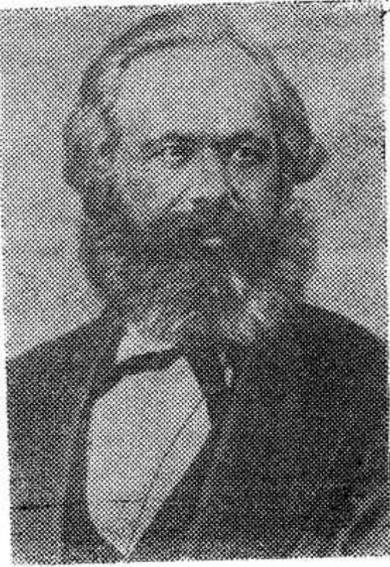
14 марта 1883 года умер Карл Маркс, основоположник научного коммунизма, великий учитель и вождь международного пролетариата, гениальный мыслитель, корифей революционной науки.