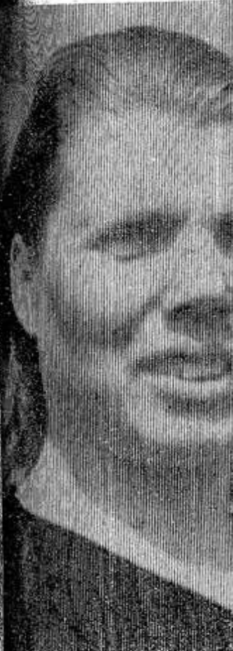
а снимке: доярка «XXI партсъезд»... В 1965 году из первой местной животноводческой...