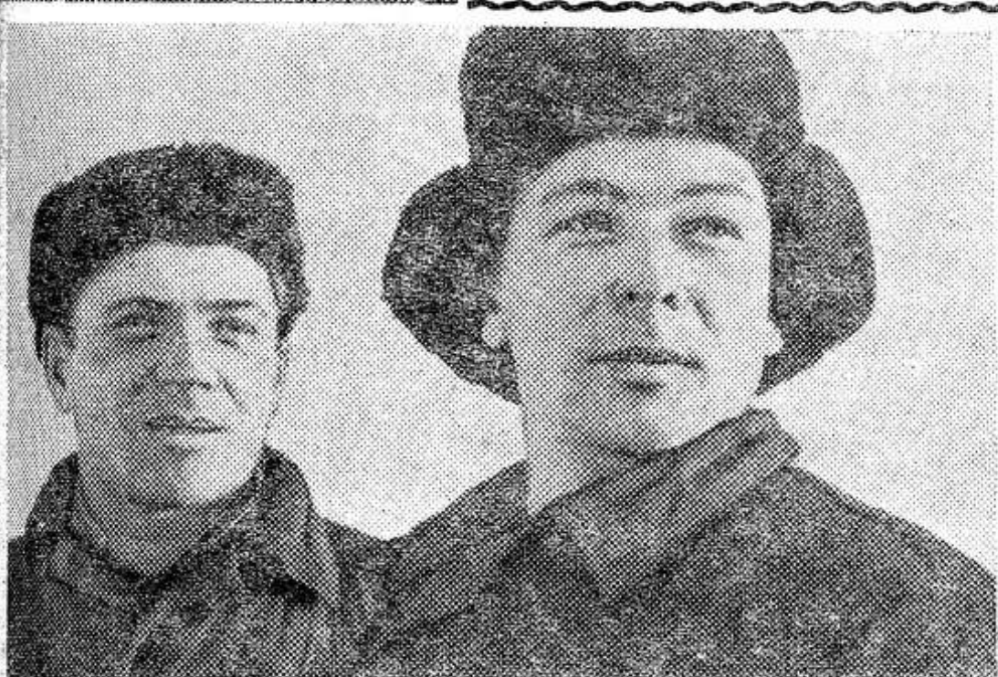
КОМИ АССР. Ни трескучие морозы, ни глубокие снега не могут помешать теплым вывозкам торфа для приготовления компостов в совхозе «Сыктывкарский». Первенство в соревновании удерживают механизаторы второго отделения. Они должны заготовить 4.000 тонн торфа, что