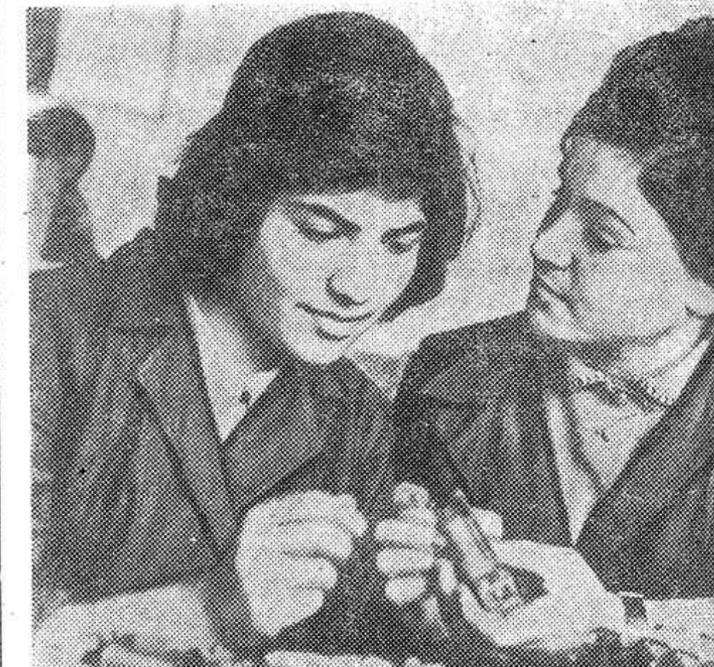
СТЕПАНОВАН (Армянская ССР). Вам позвонили по телефону, но голос собеседника плохо слышен. Не беда! Достаточно повернуть регулятор на аппарате, и голос в трубке станет «ближе» — прозвучит громче. Телефонные аппараты для отдаленных городских и сельских абонентов, позволяющие вести