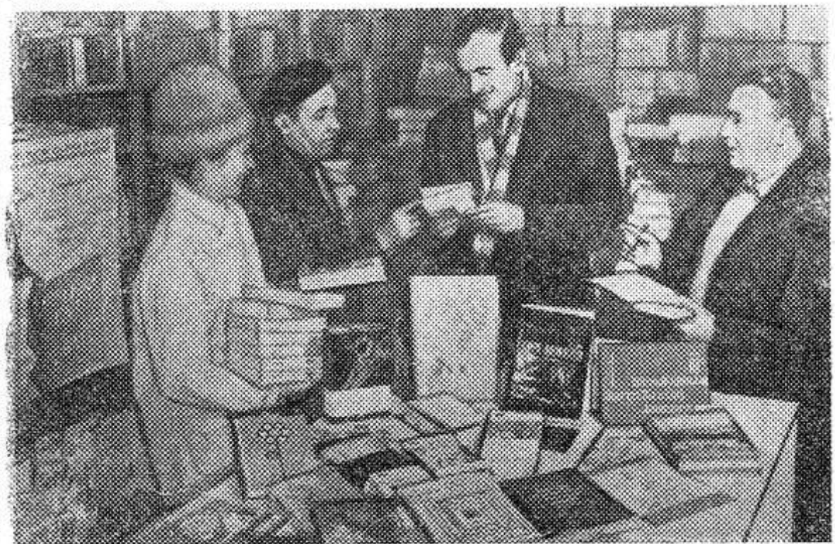
В селах и деревнях социалистической Румынии проходит традиционный месячник книги. В гостях у тружеников полей побывают в феврале писатели, поэты, научные работники. Тяга к знаниям у крестьян постоянно растет. Только за минувший год в сельской местности было продано 12 миллионов экземпляров книг.

Еще в начале XX века астрономы шутили, будто Луна изучена гораздо лучше, чем Земля. Действительно, астрономы к тому времени знали, что Луна — темный шар, диаметром в четыре раза меньше земного. Расстояние до нее — 384 тысячи километров. Период ее вращения вокруг оси равен периоду ее обращения вокруг Земли, поэтому она всегда повернута к нам одной стороной. Была составлена подробная карта лунной поверхности.