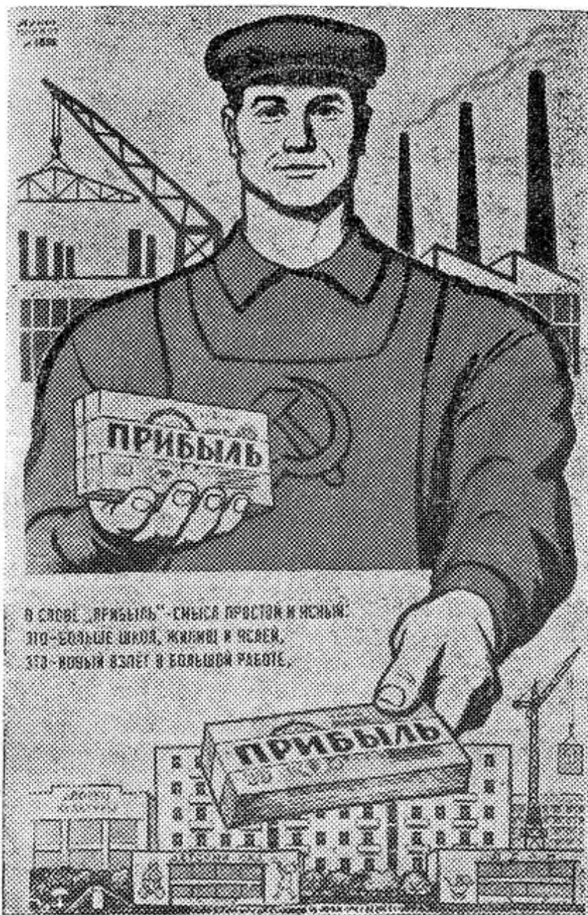
В слове «прибыль» — смысл простой и ясный. Это — больше школ, жилищ и яслей. Это — новый взлет в большой работе.

В слове «прибыль» — смысл простой и ясный. Это — больше школ, жилищ и яслей. Это — новый взлет в большой работе. К коммунизму путь, в конечном счете! Художник В. Говорков. Стихи Э. Иодковского.