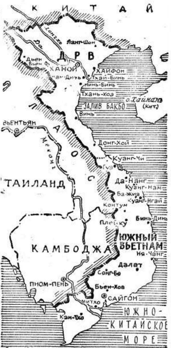
К событиям в Южном Вьетнаме.

Логика жизни подсказывает США только один разумный выход из тупика — уйти из Южного Вьетнама. Но американские империалисты все еще упрямо ратуют за дальнейшее расширение войны.