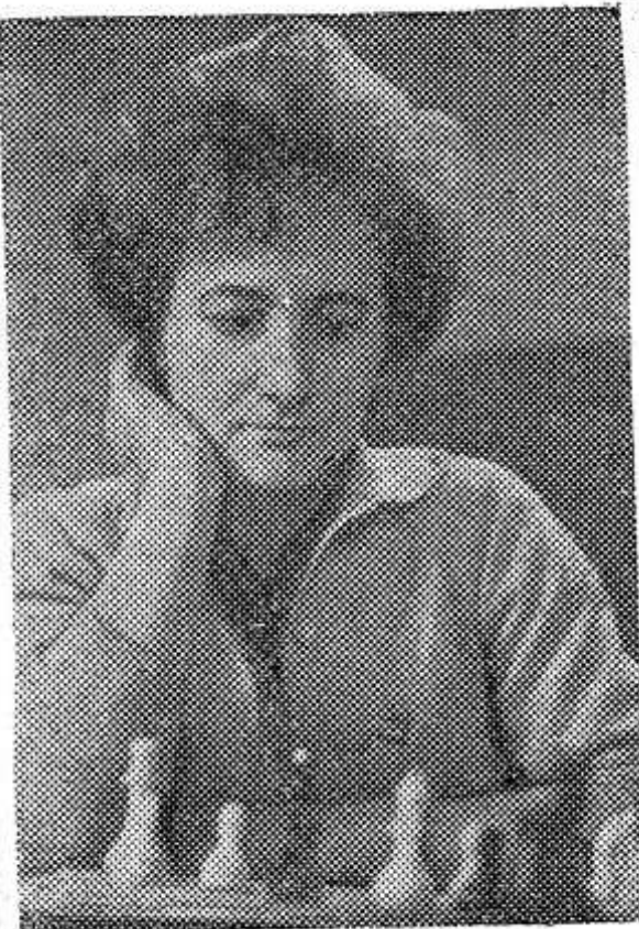
МОЛДАВСКАЯ ССР. В городе Бельцы закончился XXV юбилейный чемпионат СССР по шахматам среди женщин.

Несколько десятков зайцев-русаков в ноябре прошлого года завезено из Псковской области. Зайцы выпущены на охотничьи угодья Тосненского района.