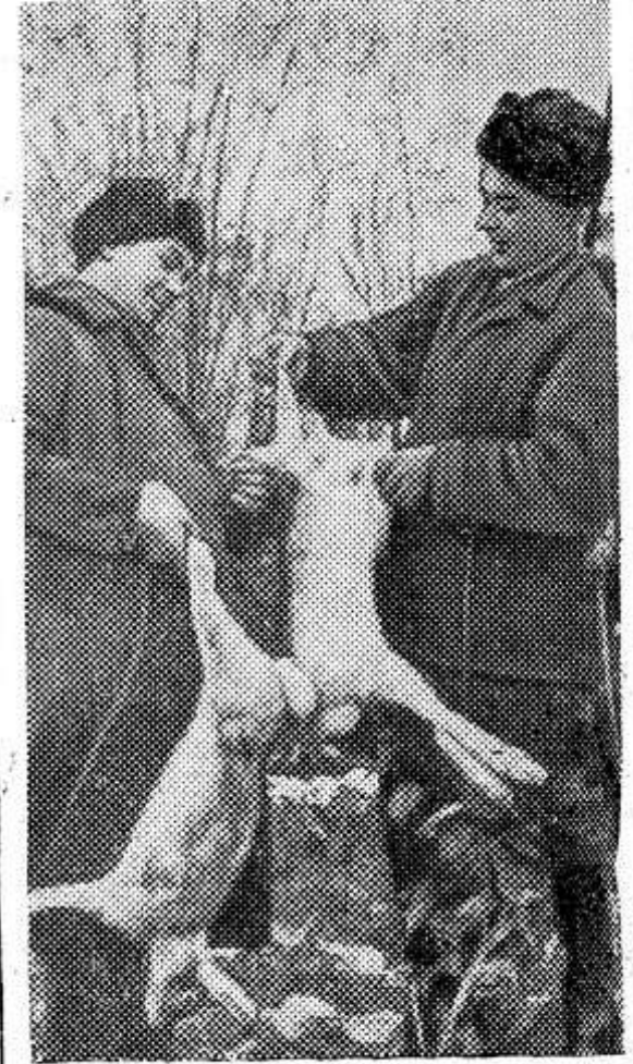
АРХАНГЕЛЬСКАЯ ОБЛАСТЬ. Разрешена охота на зайца. Охотники-любители давно ждали этого дня. В Холмогорском охотничьем хозяйстве «урожай» на беляка нынче хороший. Норму их отстрела контролируют общественные инспекторы.