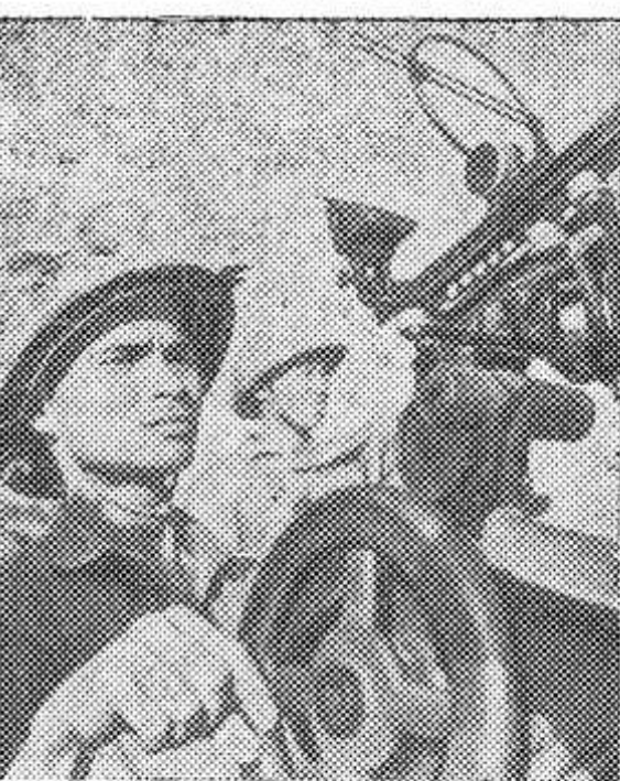
ДЕМОКРАТИЧЕСКАЯ РЕСПУБЛИКА ВЬЕТНАМ. Вместе с воинами Вьетнамской Народной армии с оружием в руках защищают родину бойцы народной милиции и отрядов самообороны. НА СНИМКЕ: бойцы отряда самообороны суперфосфатного завода Лам Тхао в провинции Фу-тхо на военной учебе.

Художественный фильм „РАЗВОДОВ НЕ БУДЕТ“ . Начало сеансов в 18 и 20 часов.