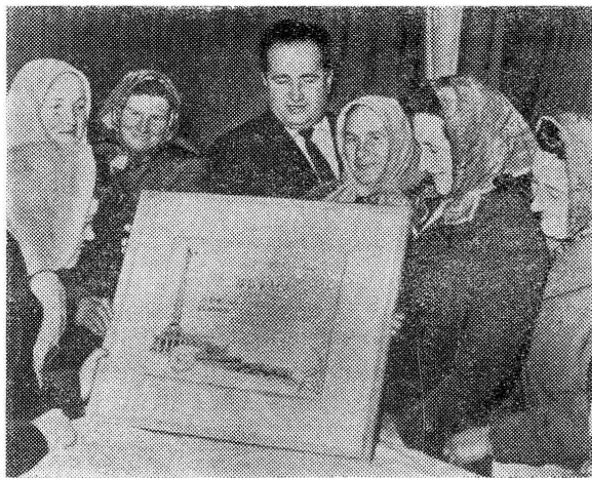
ЧЕХОСЛОВАЦКАЯ СОЦИАЛИСТИЧЕСКАЯ РЕСПУБЛИКА. Объединенный сельскохозяйственный кооператив «Рача» близ Братиславы удостоен почетного звания кооператива че-

ПРОДОЛЖАЕТСЯ подписка на газету „КРАСНЫЙ МАЯК“. Газета выходит по средам, пятницам и воскресеньям. ПОДПИСНАЯ ПЛАТА: на месяц — 19 копеек, на квартал — 57 копеек, на полгода — 1 руб. 14 копеек. Подписка принимается во всех отделениях связи, а также общественными распространителями печати.