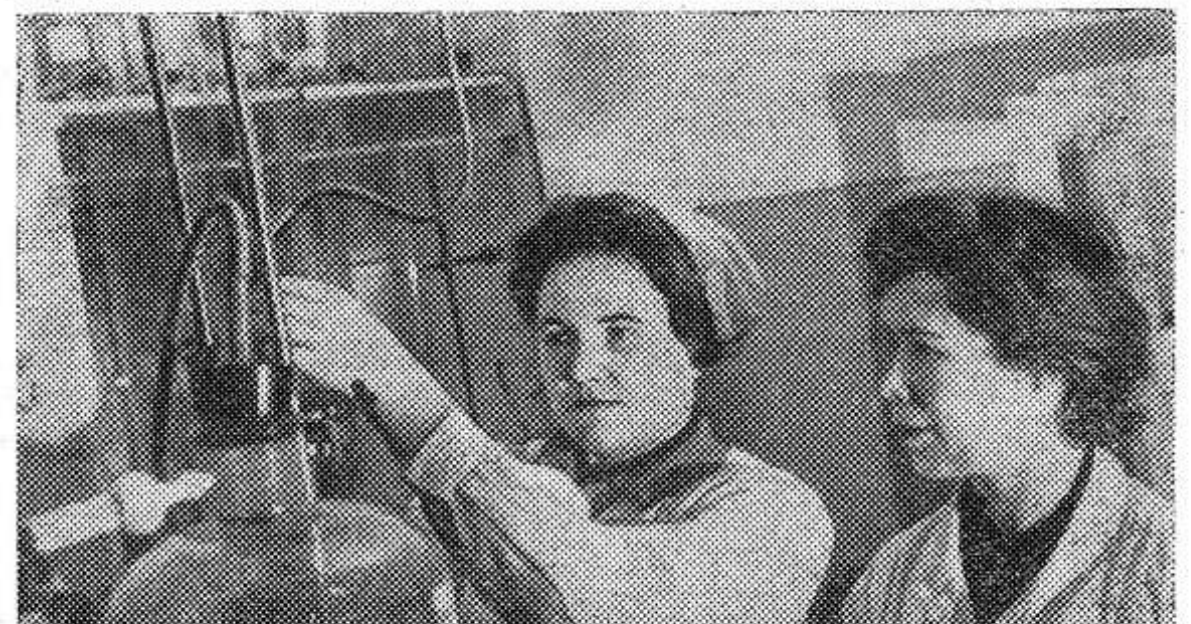
Псковская зональная агрохимическая лаборатория действует около года. За это время ее сотрудники побывали в 15 колхозах и совхозах области и обследовали там почвы на площади около 50 тысяч гектаров.

Многие партийные организации направили к избирателям агитаторов для разъяснения положений о выборах.