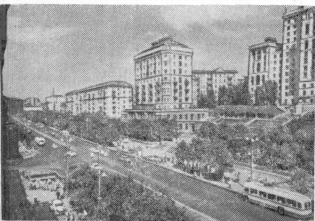
Киев. Крещатик.

Выполнению этих главных задач и должна быть подчинена вся организаторская и массово-политическая работа партийных, комсомольских и профсоюзных организаций, сельских Советов. Их долг — еще шире развернуть социалистическое соревнование в честь 48-й годовщины Великой Октябрьской и XXIII съезда КПСС.