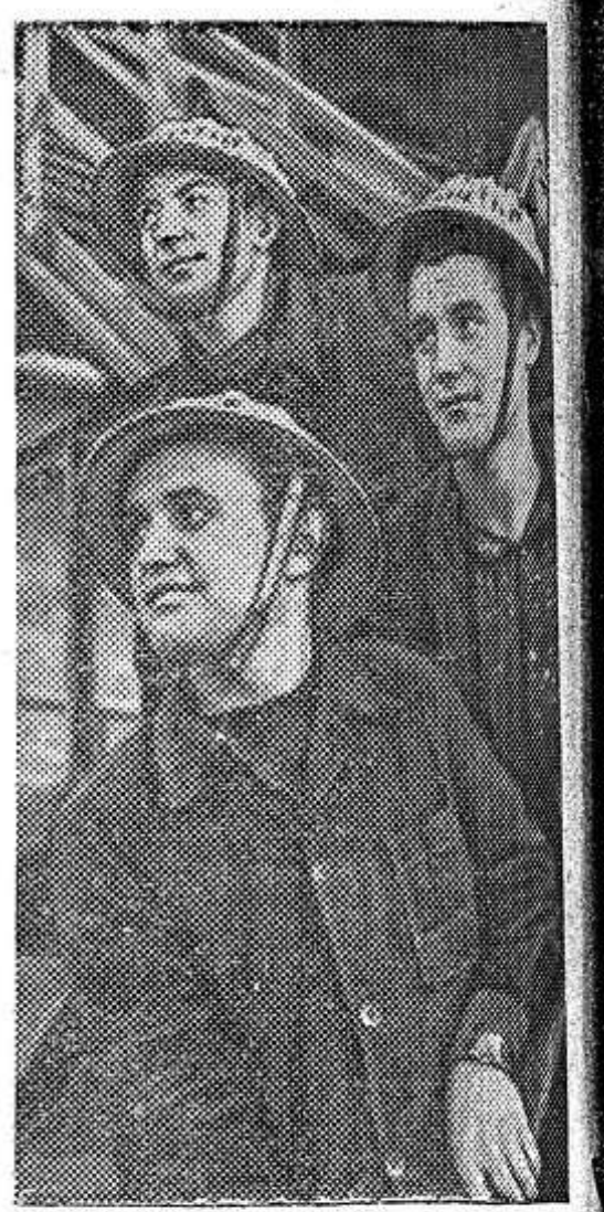
ОРЕНБУРГСКАЯ ОБЛАСТЬ. Гайская горнообогатительная фабрика — важнейший пусковой объект среди ударных строек семилетки. В комплекс ее входит свыше 30 сооружений.

Намного улучшили работу тематические секции: общеполитическая, государство и право, медицинская, чего нельзя сказать о секции атеизма. Неудовлетворительно работают сельскохозяйственная, технико-экономи-