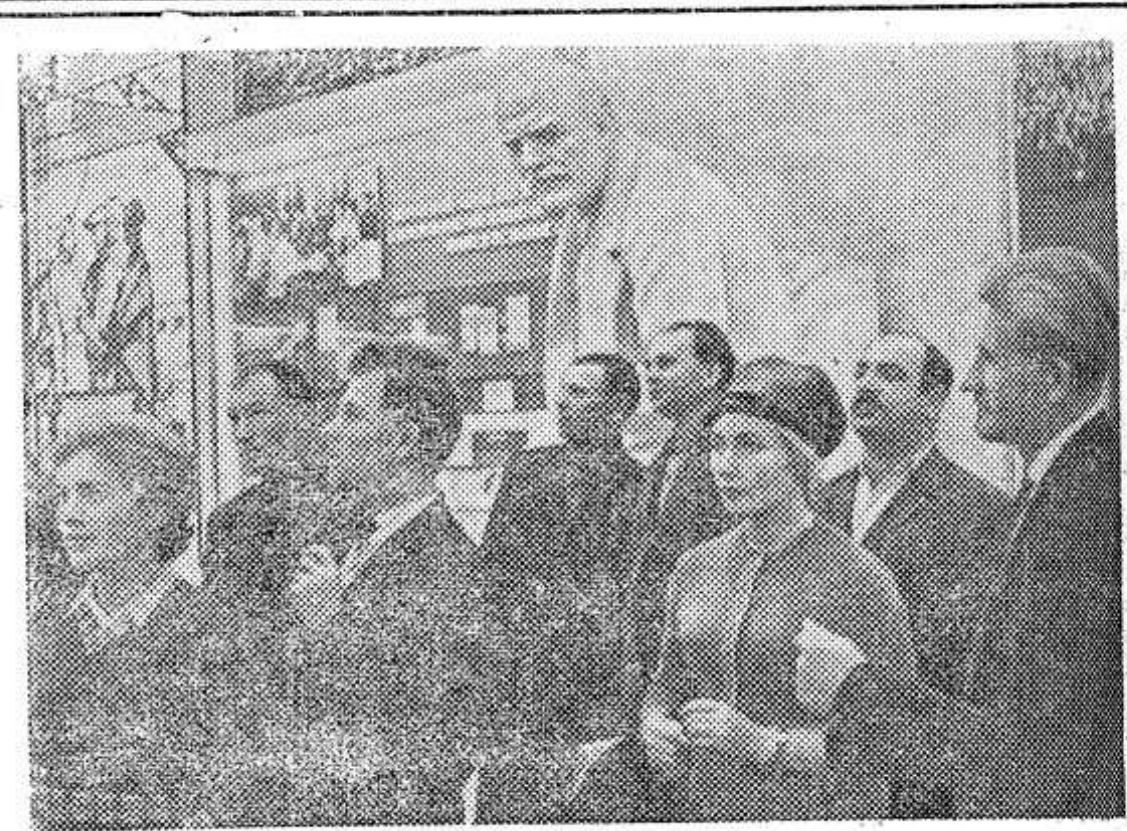
МОСКВА. В Центральном музее В. И. Ленина открылась новая экспозиция. Она рассказывает о том, как претворяются ленинские идеи в жизнь. В экспозицию включены новые документы В. И. Ленина в связи с выходом в свет полного собрания его Сочинений. НА СНИМКЕ: посетители осматривают новые экспонаты.