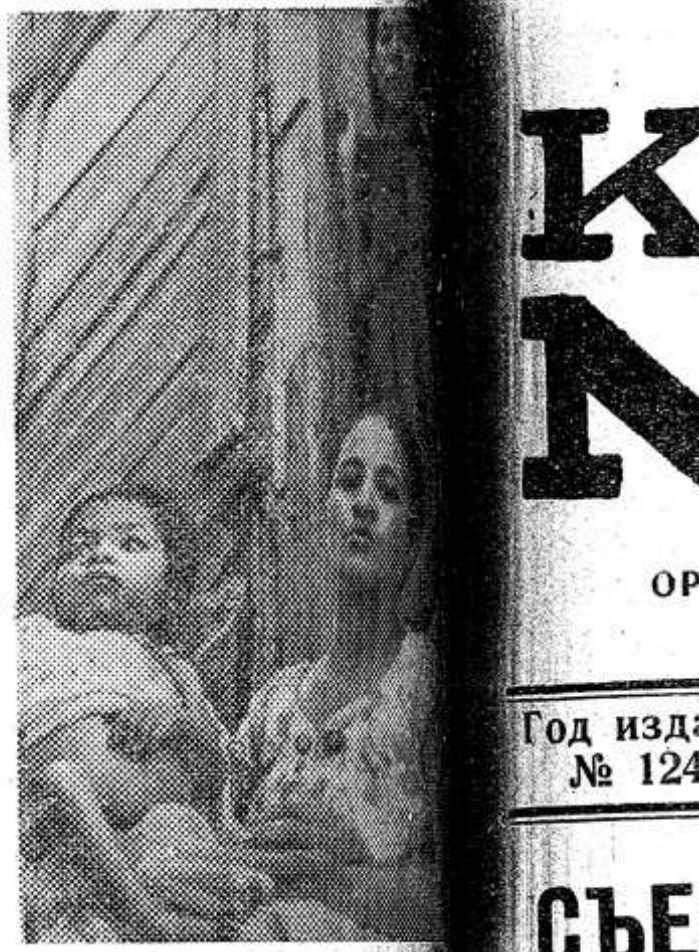
Богатый край бедняков — называют Венесуэлу. Большая часть населения этой маленько щедро наделенной природой страны влечет полнищенское существование. По официальным сведениям, ежегодно от голода в стране умирают сотни тысяч человек. Очень плохо поставлено медицинское обслуживание. Особенно пагубно это отражается на детях: каждый год тысячи заболевших легких умирают, 4 тысячи детей до четырехлетнего возраста.

НА СНИМКЕ: семья бедняков.