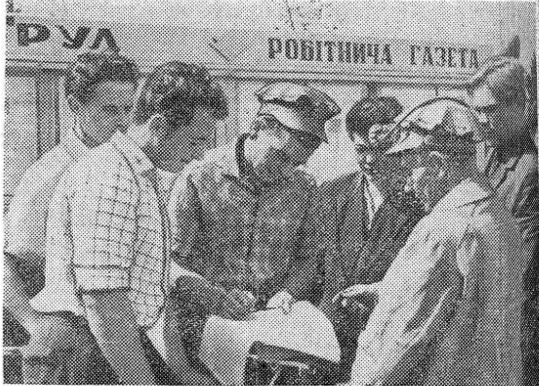
ВОЛЫНСКАЯ ОБЛАСТЬ. Трудно найти рабочую или колхозную семью, которой бы ежедневно заботливые почтальоны не приносили газеты и журналы. Сейчас, когда объявлена подписка на 1966 год, постоянные читатели газет и журналов спешат ее оформить.