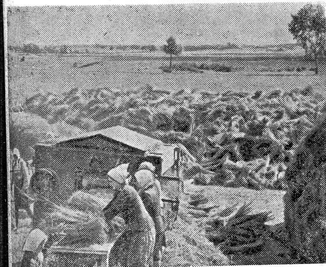
Более 350 тысяч рублей дохода принесет в нынешнем году лен колхозу «Красный Октябрь» Столбцовского района Минской области.