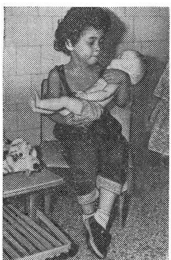
Эта маленькая «мама», баюкающая куклу, — воспитанница интерната для детей-сирот. В Кубинской Республике созданы детские учреждения, в которых воспитываются и учатся ребята, потерявшие родителей.

Совет Безопасности принял резолюцию о прекращении огня между Индией и Пакистаном.