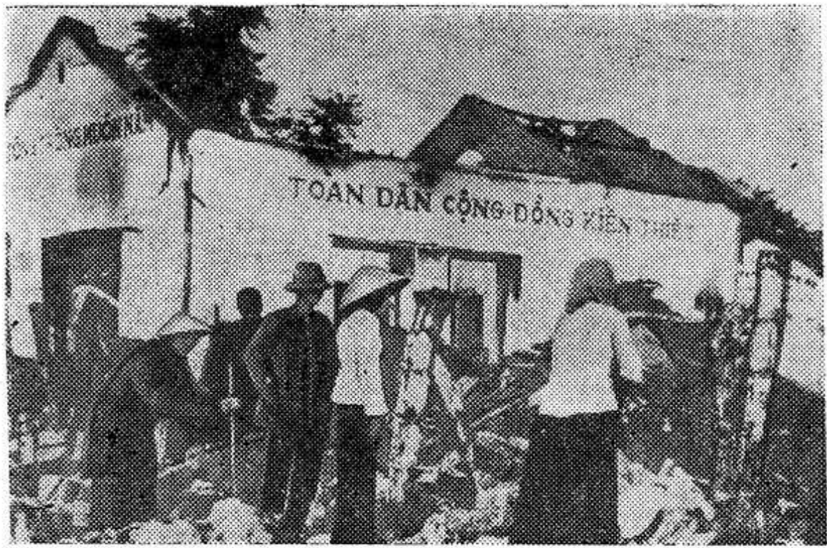
Патриоты Южного Вьетнама наносят чувствительные удары по правительственным войскам, совершают нападения на посты