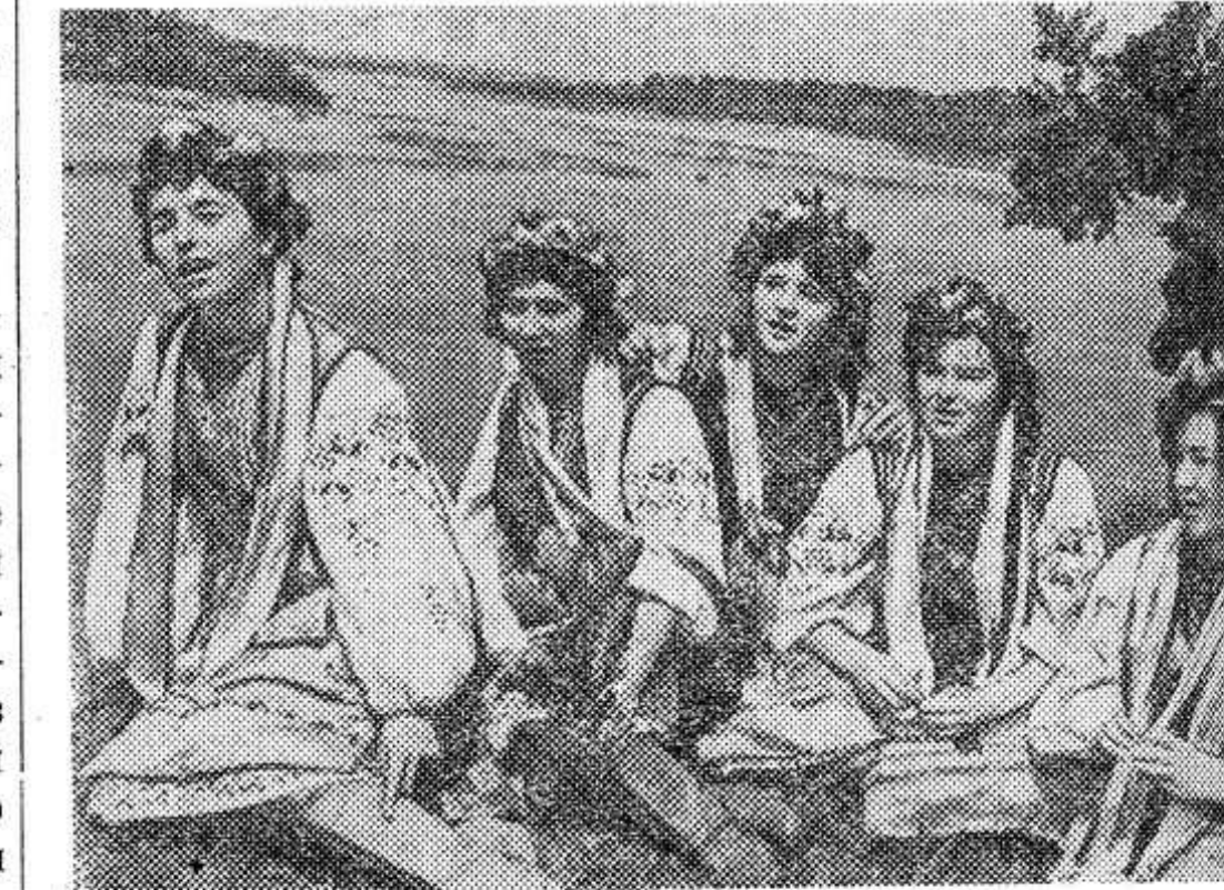
Участницы художественной самодеятельности Черногородского завода синтетического волокна во время отдыха на берегу Десны.