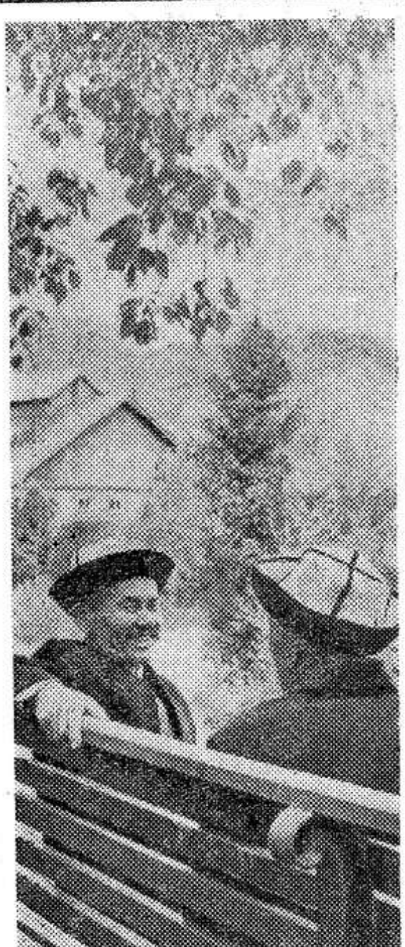
В Иссык-Кульской котловине на северном склоне хребта Терской Ала-тау, в живописном ущелье на высоте 2.400 метров над уровнем моря, расположен бальнеологический курорт Киргизии «Джесги-Огуз».