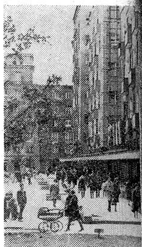
Нова Гута — один из самых молодых и красивых городов Польши. Он вырос у стен Брестского Кракова вблизи крупнейшего в стране металлургического комбината имени В. И. Ленина.

Надемся, что в текущем месяце редакционная почта будет еще богаче. Значит, и газета станет содержательней и интересней.