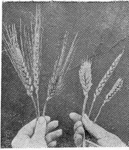
Колосья пшеницы; средний колос в каждой группе — контроль, а другие получены с помощью химических мутагенов сотрудниками лаборатории.