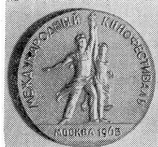
МОСКВА. Приз IV Международного кинофестиваля «За гуманизм киноискусства, за мир и дружбу между народами».

По сообщению метеорологической станции, на территории нашего района 23 июля и в последующие два дня ожидается теплая погода. Местами дожди с грозами. Ветер слабый. Температура ночью 8—13 градусов тепла, днем 20—25.