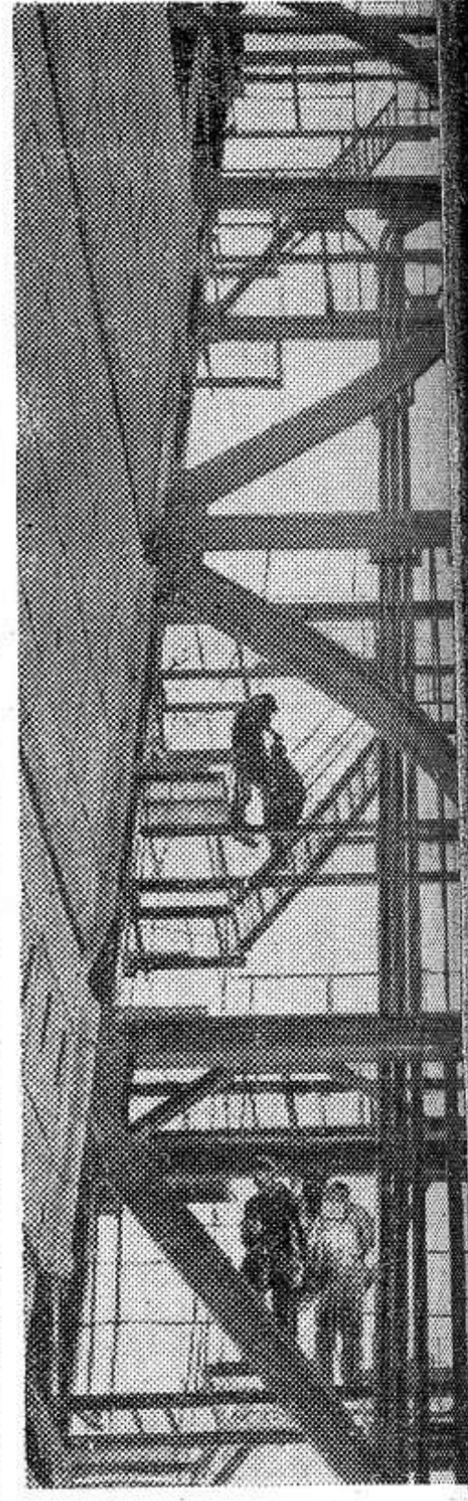
В энергосистему Узбекистана дал промышленный ток третий турбогенератор Ташкентской ГРЭС. Мощность его — 150 тысяч киловатт.

Ведется строительство четвертого энергоблока такой же мощности. Со сдачей его в эксплуатацию строительство первой очереди ГРЭС будет завершено.