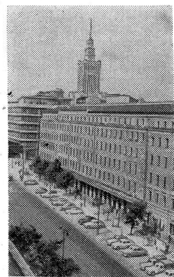
ВАРШАВА. Иерусалимская аллея. Вдали — здание Дворца культуры и науки, сооруженное Советским Союзом в дар польскому народу.