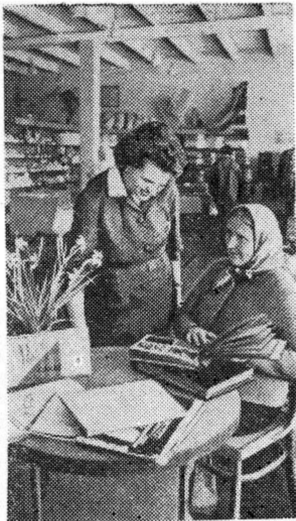
ЛАТВИЙСКАЯ ССР. По итогам соревнования за первый квартал нынешнего года «Латпотребсоюз» присуждены первая денежная премия и переходящее Красное знамя Совета Министров СССР и ВЦСПС.

В сельских районах республики магазины работают по-новому, осваивая прогрессивные формы организации труда. Расширилась продажа товаров по заказам покупателей и в кредит.